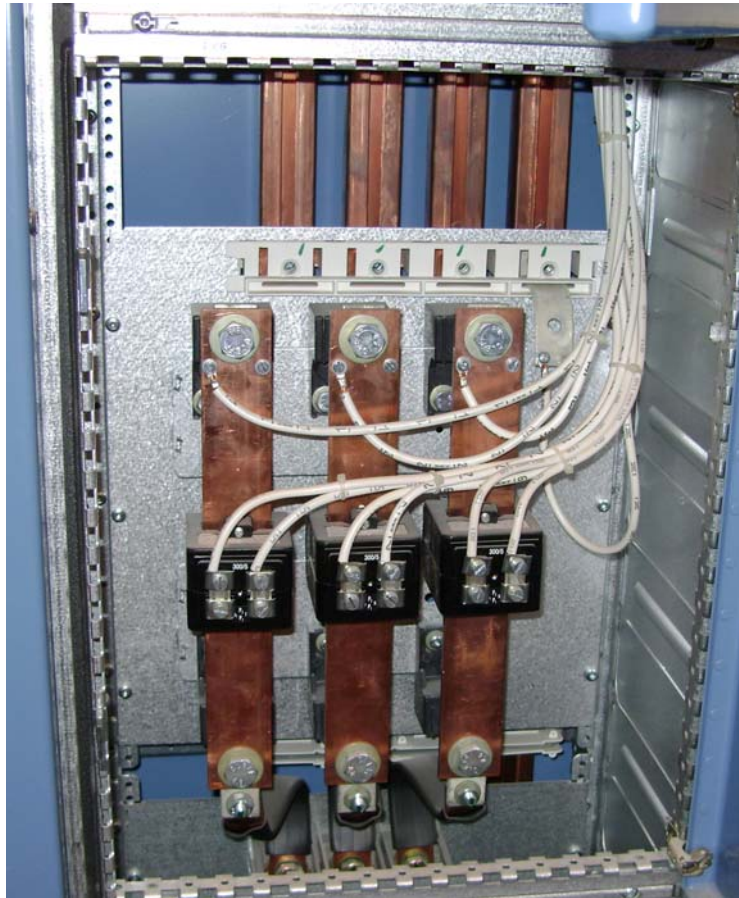
Målepunkt til Ejendommens fælles forbrug.